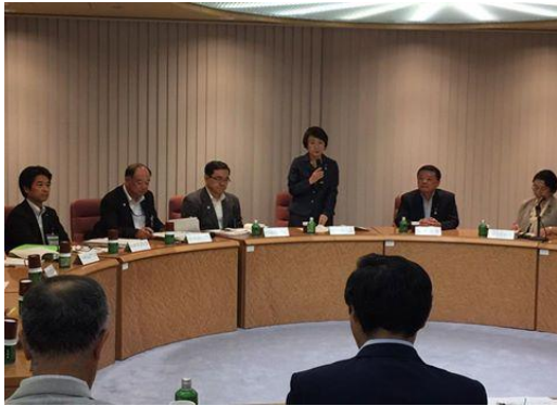
6月21日神奈川県庁にて

瀬谷区の北側の大半の面積を占める上瀬谷通信施設が返還され、いよいよ方向性を出そうと言う話がまとまって来ました。本年度、横浜市と国が調査費を予算計上しました。