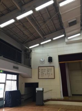
県立三ツ境養護学校