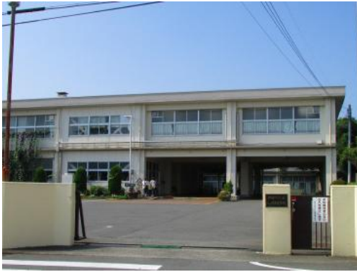
県立三ツ境養護学校 瀬谷区二つ橋町 468 番地